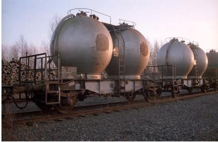
Wagon pour le vrac